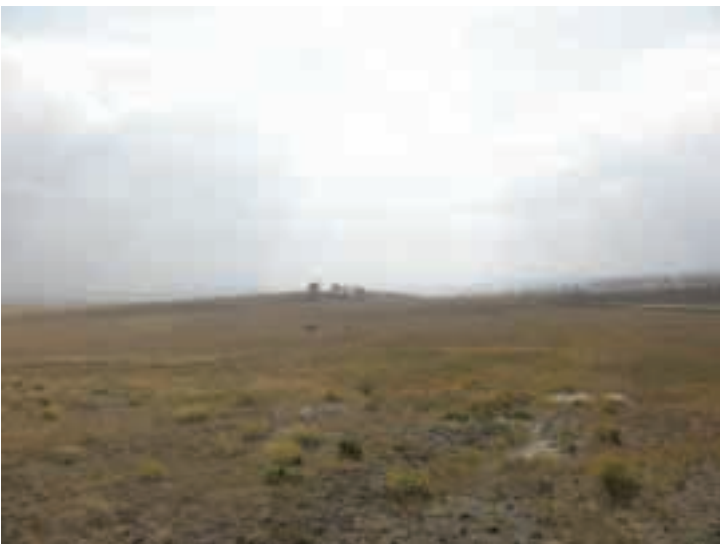
製鉄炉・鍛冶工房をもつ古代遊牧民族の集落 (チェルノエ・オゼロ遺跡、ハカス共和国) Ancient nomadic settlement with smelting furnace and blacksmith(Chelnoe Ozero, Khakas Republic)