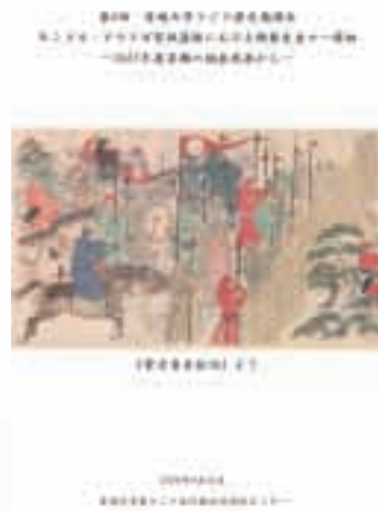
Report on the trace of blacksmith in Genghis Khan's palace

愛媛大学 東アジア古代鉄文化研究 センター 790-8577 愛媛県松山市文京町3