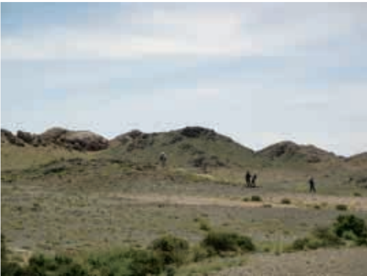
青銅器時代の銅鉱石採掘遺跡 (モンゴル・ゴビ地区) Copper mining site, Bronze age(Gobi region, Mongolia)