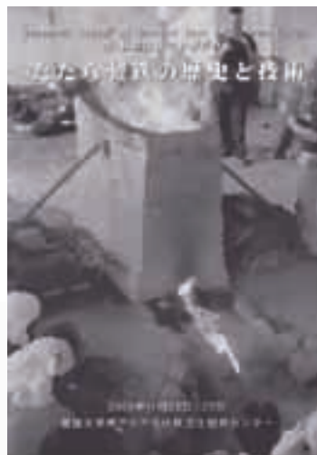
History and Technique of TATARA