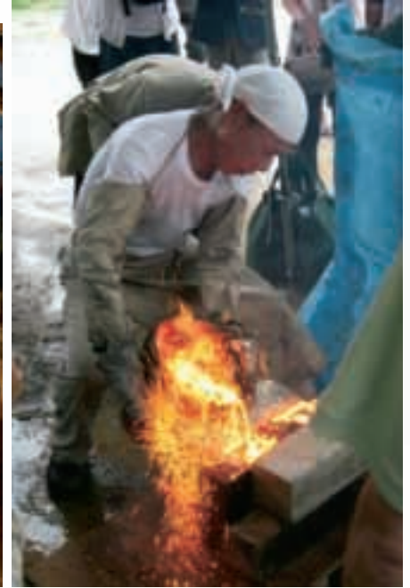
故高橋一夫氏による青銅鑄造技術再現（愛媛大学）

Reconstructed operation of Kofun period's furnace(Ehime University)