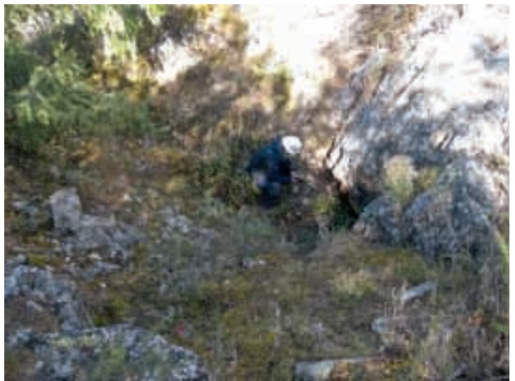
青銅器時代の銅鉱石採掘遺跡 (アバザ地区、ハカス共和国) Copper mining site, Bronze age (Abaza region, Khakas Republic)