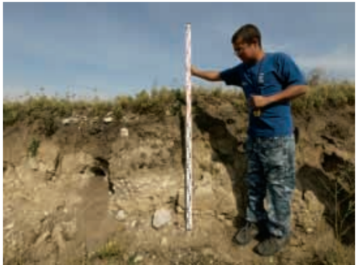
古代遊牧民族の製鉄炉 (トロシュキノ遺跡、ハカス共和国) Ancient nomadic furnace for iron smelting(Troshukino, Khakas Republic)