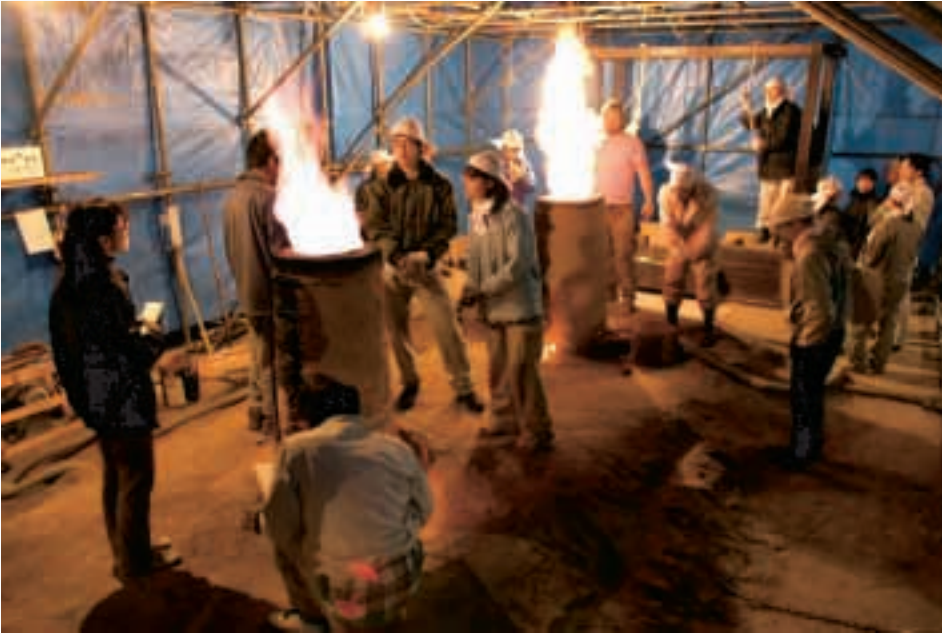
古墳時代製鉄炉の復元操業（愛媛大学）

It is one of the purposes of AIC to reconstruct the former technology based on the result of the analysis on archaeological materials. We are aiming at the archive construction of the lost technology.