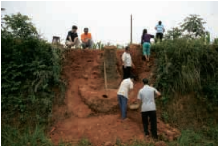
漢代製鉄炉 (古石山遺跡・四川省) Furnace for iron smelting, Han period(Gushishan , Sichuan )