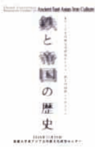
Iron and Empire

The symposium and the lectures on metal production and their culture are held two or three times in a year.