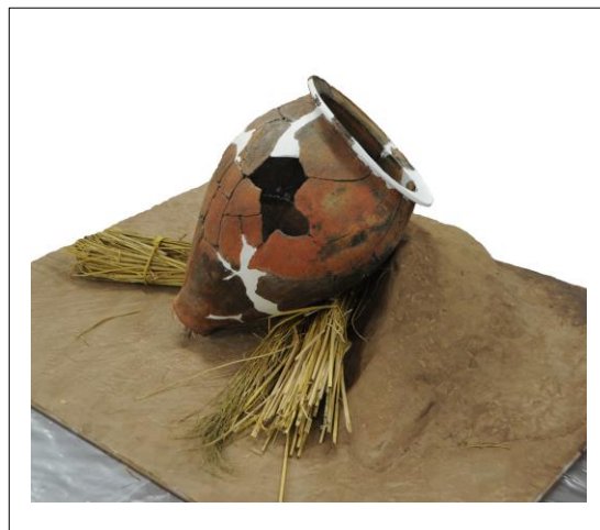
甕を斜めに傾けて煮炊きしていた様子（復元）