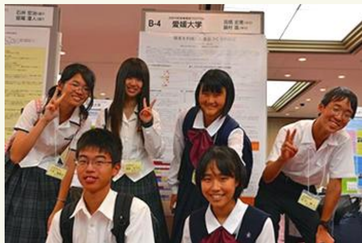
ポスター発表が終わってほっと一息