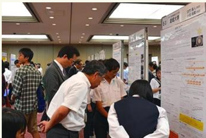
多くの人が熱心に発表を聴き多くの質問をもらいました

その結果、反応温度が甘酒より20℃低い40℃で、反応速度を6倍にすることに成功しました。また、甘酒と同様にアミラーゼとマルターゼを両方入れた場合にもっとも反応速度が速いこと、ニホンコウジカビがもっとも反応速度が遅いことが明らかになりました。米粉、もち粉、片栗粉、はったい粉、はだか麦と片栗粉など、さまざまな条件で、酵素反応や生物発酵を行い、水あめを製造しました。そして、12～35人を対象にした官能評価の結果、デンプンは片栗粉、条件はアミラーゼ1%濃度、40℃、60分がもっともおいしいという結果を得ました。なぜ穀類デンプンと根茎デンプンでは、根茎デンプンの評価が高いかなどについて今後も研究を続けていきます。