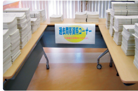
過去問等資料コーナー

本学では,学生の海外研修・留学を積極的に支援しています。また,学内でも留学生と交流する機会を提供しています。興味のある方は,お気軽にお立ち寄りください。