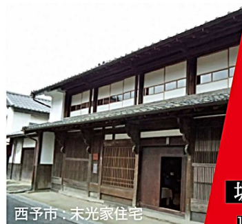
西予市：末光家住宅

妖怪が暗夜に練り歩くことを「百鬼夜行」というそうです。この「百鬼夜行」の意味をもとに、100人の老若男女が100の器を持って和紅茶会を開催し、卯之町の古い町並みを練り歩くことをイメージして「百器紅茶会」と名付けました。百器紅茶会とは、妖怪ではなく愉快な人々が集う和のティーパーティーです。ここから新しい西予市が生まれます。