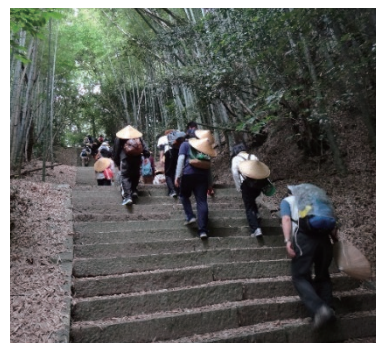
愛媛大学生と遍路道を歩く

国内研究部門では、四国遍路の古代から現代までの歴史的諸相を学際的に解明し、また現代遍路の多様な実態をフィールド調査などを通して具体的に明らかにします。国際研究部門では、世界各地の巡礼の歴史や現在の諸様相を明らかにし、あわせて四国遍路と世界の巡礼との国際比較を行います。