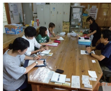
地域ステークホルダーからの聞き取り調査

本センターは、①理系・文系の様々な分野の視点、理論、手法を駆使し、②地域のステークホルダーや学生とともに地域課題に取り組むため、「地域共創理論研究部門」「地域共創実践研究部門」の2部門を設置しています。本センターは、地域に軸足を置いた研究活動を発展させ、地域に関する新しい学際的な学術領域の創造、地域の自立的な発展への貢献、地域社会の発展を支える人材の育成を目指し、海外研究・貢献も積極的に行います。