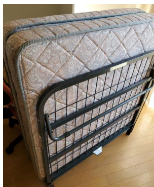
ベッドマット 閉じた状態