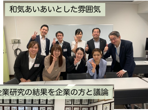
企業研究の結果を企業の方と議論