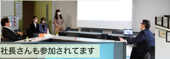
社長さんも参加されてます