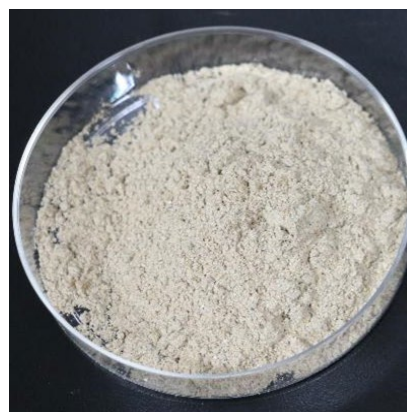
飼料用昆虫（左）とその粉末（右）