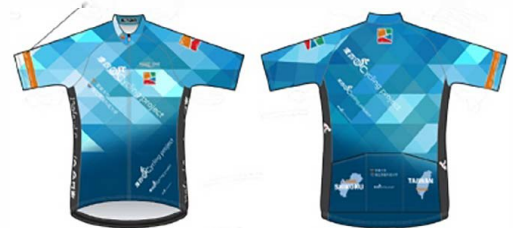
オリジナルサイクリングジャージ

オリジナルサイクリングジャージを作成します。 ※参加費に含まれています。 ※サイズ等は実施要項を参照してください。