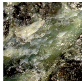
蛇紋岩の顕微鏡写真

皆さんは「鉱物」というものを知っていますか？岩石やいわゆる石ころの構成成分であり、宝石として活用されるものもあります。地球の大部分は鉱物で構成されていますが、私たちが目に見ることができるのは表面のごく一部です。この、今、手にとって見とることができる鉱物たちは、初めからそこにいたのではなく地球の中を長い時間をかけ、姿を変えながら旅してきました。その痕跡を読み取ることで、私たちの見ることのできない場所や時間について知ることができます。一緒に地球を巡る鉱物の旅路をたどってみましょう。