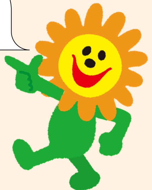
トヨタカローラ愛媛 マスコットキャラクター「スマイリン」