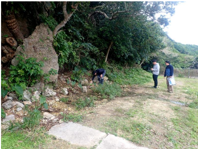
図 3. ミヤコサワガニの生息地。湧水の周辺に生息している。この場所では生息環境の面積はわずか 80 平方メートル程度しか残されていない。生息地自体は保全の対象として位置付けられていないため、土地開発や環境改変によって生息地が消失するリスクがある。写真の人物は本論文共著者の 3 名。

現在、本種は、「種の保存法」に基づく国内希少野生動植物種および沖縄県の天然記念物として法的保護を受けており、捕獲や採集に対しては厳しい規制が設けられています。しかしながら、生息地そのものには法的な保全措置が適用されておらず、土地開発や環境改変による生息地消失のリスクが依然として存在しています。自治体による買い上げや捕食者となる外来種のカメ（ミナミイシガメ）の駆除活動などは進められているものの、長期的な保全を実現するためには、生息地保護に特化した法的枠組みを構築し、土地利用の制限など、より積極的な保全政策を実施する必要があると考えられます。