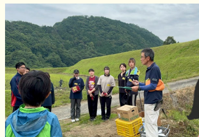
収穫体験の様子 (昨年6月)

窪野町の自然の恵みをたっぷり受けた たまねぎの収穫を体験しませんか？ 「愛媛の自然と農業にふれ合う」 特別な体験をぜひ！ 地元の農家さんともお話できます！