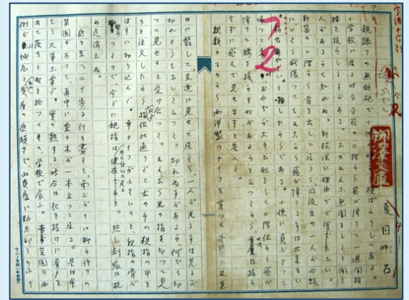
『坊っちゃん』の原稿 (1906年の原稿の複製) ＜『夏目漱石全原稿 坊っちゃん』 番町書房1970年刊＞