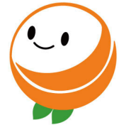
大学公式キャラクター「えみか」