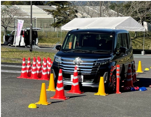
・パーキングサポートブレーキ体験